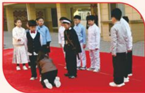
▲ 洛滨小学《为中华之崛起而读书》剧照