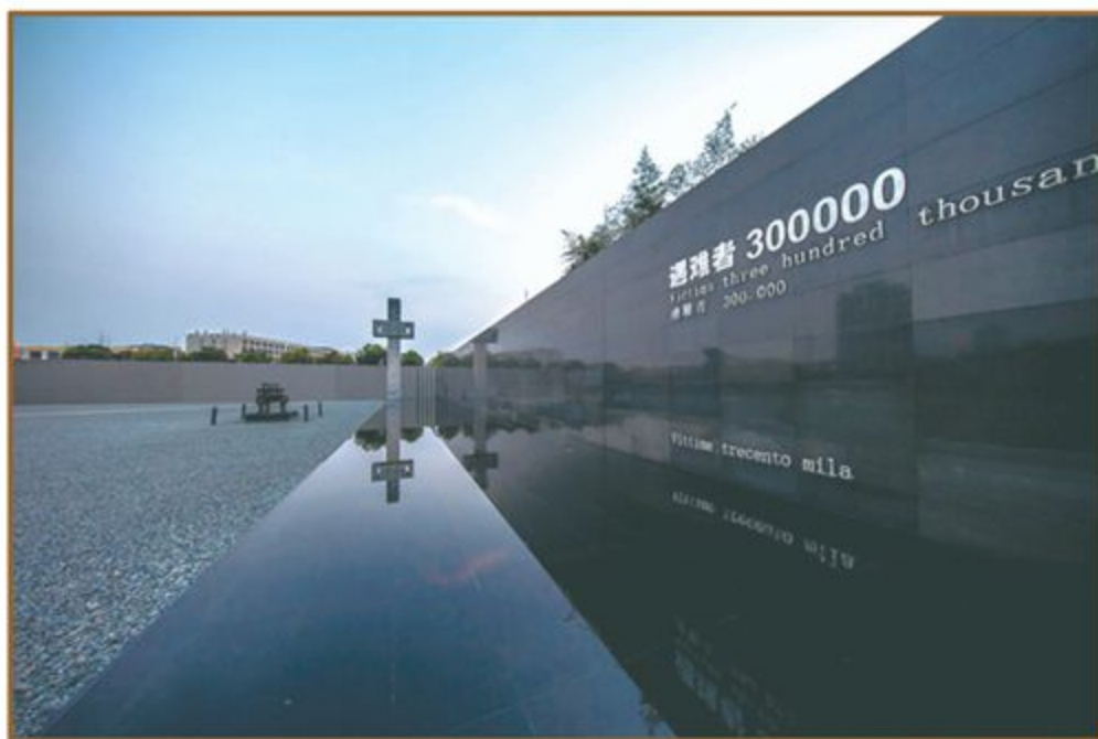
侵华日军南京大屠杀遇难同胞纪念馆