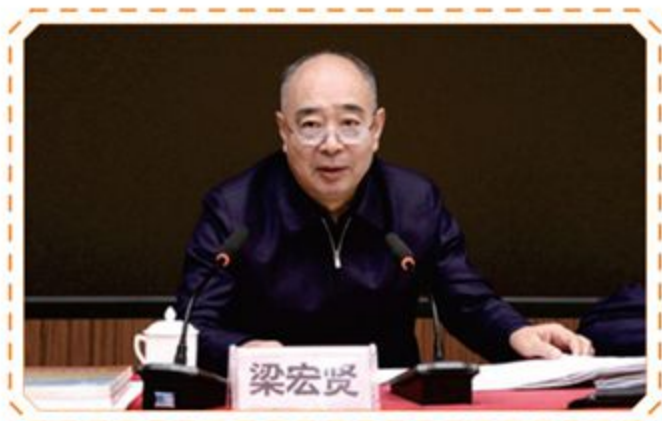
▲省延会梁宏贤会长作重要讲话

12月5日，陕西省延安精神研究会“弘扬延安精神 培育时代新人”全省延安精神进校园现场观摩交流会在我县举行，省延安精神研究会会长、省人大常委会原副主任梁宏贤，渭南市人大常委会副主任杨翠红等领导出席会议，中共大荔县委书记由建新出席会议并致辞。参加会议的还有全省各市级研究会主要领导和部分县（区）延安精神研究会及相关中小学负责人、教师代表等。