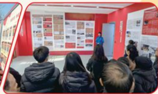
▲ 冯翊初中红色展室一角