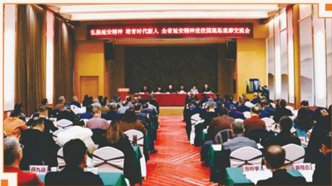
全省延安精神进校园现场观摩交流会现场