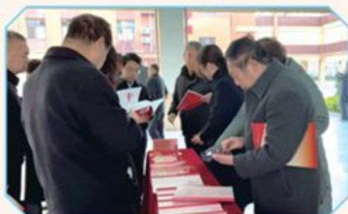
▲ 与会人员洛滨小学翻阅资料