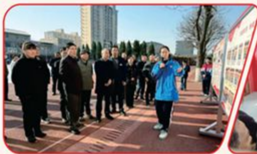
▲ 与会领导冯翊初中观摩