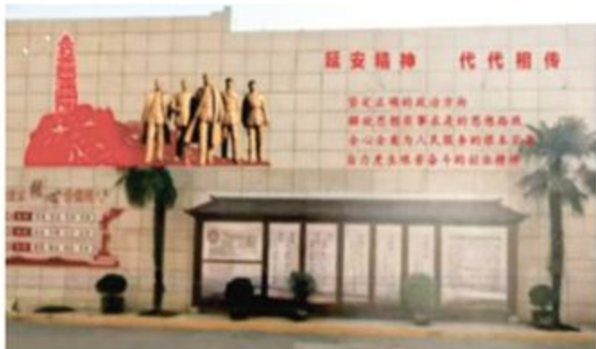
▲ 冯翊初中红色文化墙

走进冯翊初中，校门口的红色文化宣传墙成为校园文化的标志性景观，综合楼内70多平方米的红色展室系统展示着党史与本地革命史料；洛滨小学红色长廊里，红色故事展板与LED屏滚动播放的红色标语，让校园每一处都成为育人场景。县延会指导示范学校不断加强校园红色阵地建设，打造了立体多维的宣传环境，让学生在耳濡目染中感受红色革命精神的魅力。