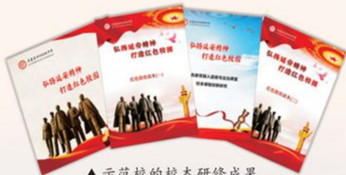
▲ 示范校的校本研修成果