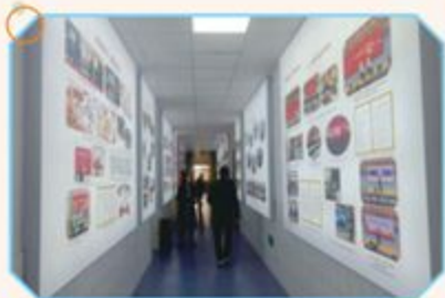
▲ 冯翊初中红色展室外走廊