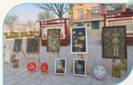
▲ 洛滨小学学生手工艺品