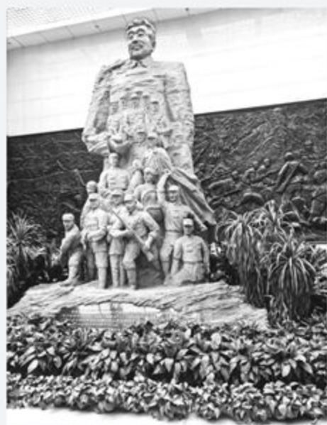
▲晋绥边区革命纪念馆塑像