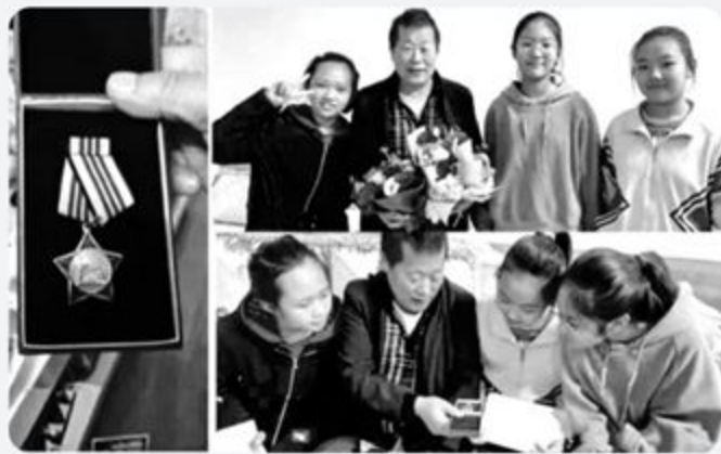
▲ 学生们探访老战士

在教学“小数的意义”时，学生们测量碑高，把14.8米拆解为14米8分米。此时，小数概念与历史符号产生了共鸣——小数点成了由烈士鲜血凝结而成的时间刻度。