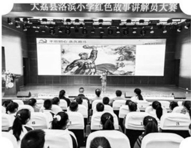
▲红色故事讲解员大赛

观沙苑基地时，他们发现900件藏品中枪械与生活用品的比例为3:2，便自主设计了一道“按比例分配”的题目：“若新增100件藏品，应增加多少件生活用品？”从被动接受知识转变为主动创造，他们真正成了课堂的主人。